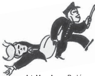
Art: Mary Agnes Rodríguez