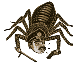
Art: Ravi Zupa

La calavera migrante muy indignada le reclama a la policía esa inhumana fechoría.