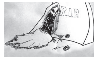
Art: Stella Marroquin