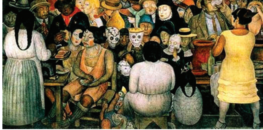
Art: Day of the Dead 1924, Diego Rivera